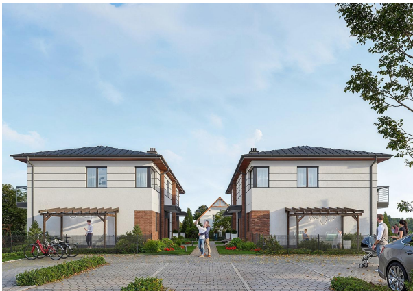
KARTA LOKALU I.B.2